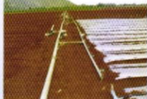
Không dùng màng phủ