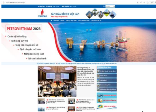
Webiste chính thống của Tập đoàn Dầu khí Việt Nam sử dụng tên miền quốc gia “.vn” (pvn.vn)