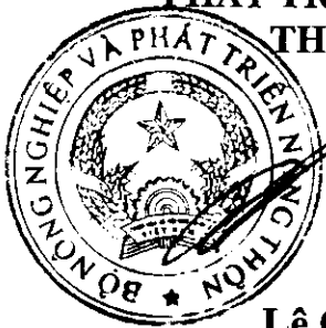
Lê Quốc Doanh

KT. BỘ TRƯỞNG BỘ NÔNG NGHIỆP VÀ PHÁT TRIỂN NÔNG THÔN THỨ TRƯỞNG